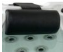
Nackkudde till utomhusspa