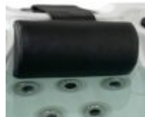
Nackkudde till utomhusspa