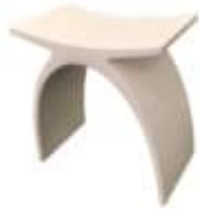
Læsø pall, RockSolid™