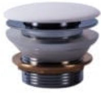
Pop-up bottenventil med Rock Solid topp