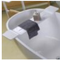
Badkarsbricka i RockSolid™