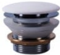
Pop-up bottenventil med Rock Solid topp