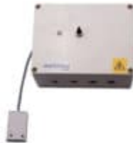
Automatisk vattenpåfyllare till utomhusspa