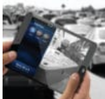
Balboa Wifi-modul till utomhusspa