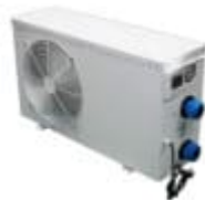
Värmepump 5,5 kw till utomhusspa