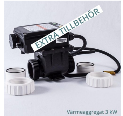
Värmeaggregat 3 kW