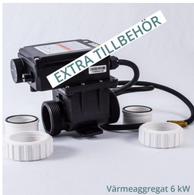
Värmeaggregat 6 kW