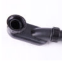
Avloppssats med vattenlås och flexslang