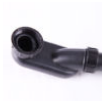
Avloppssats med vattenlås och flexslang