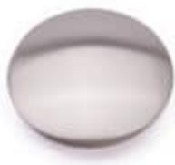
Lock till bottenventil, borstat stål