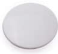
Lock till bottenventil, matt vit